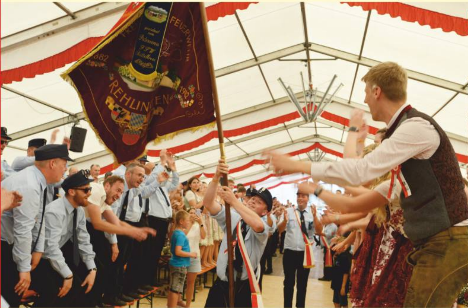
Eindrucksvoller Einzug der Rehlinger Fahne nach dem Festzug

Gemeinde Langenaltheim Langenaltheim • Büttelbronn • Rehlingen